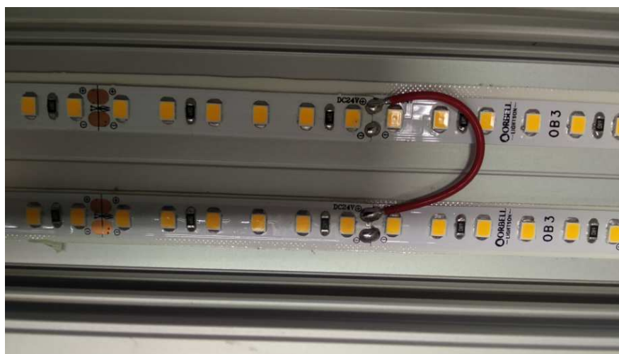
צילום מעגל הלדים