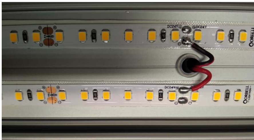
צילום מעגל הלדים