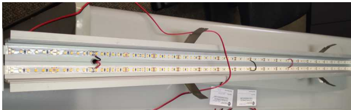
צילום גוף התאורה