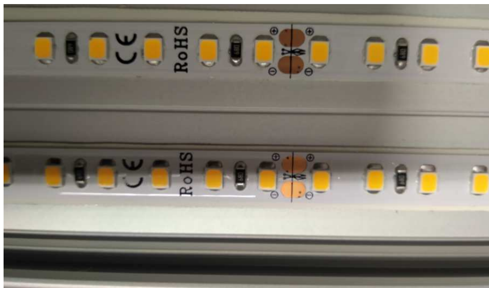
צילום מעגל הלדים