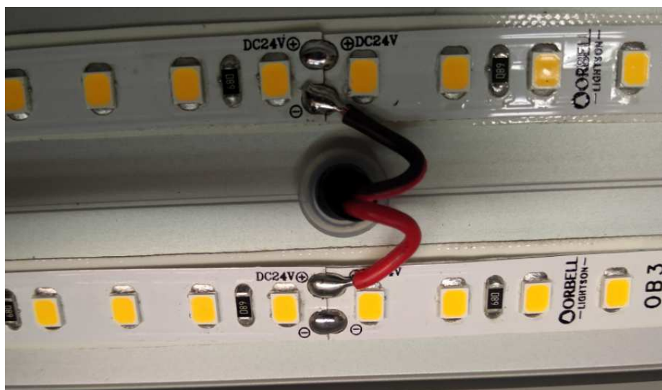
צילום מעגל הלדים